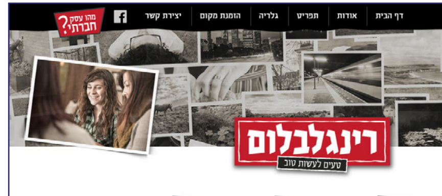
קפה רינגלבלום, מודל לעסק חברתי מקומי

• שוק מזון שכונתי מרכז קיימות מקומי יכול ליצור מרחב למכירת תוצרת מגיבון מקומי ומוצרי מזון מעסקים חברתיים ועסקים ביתיים של תושבי השכונה.