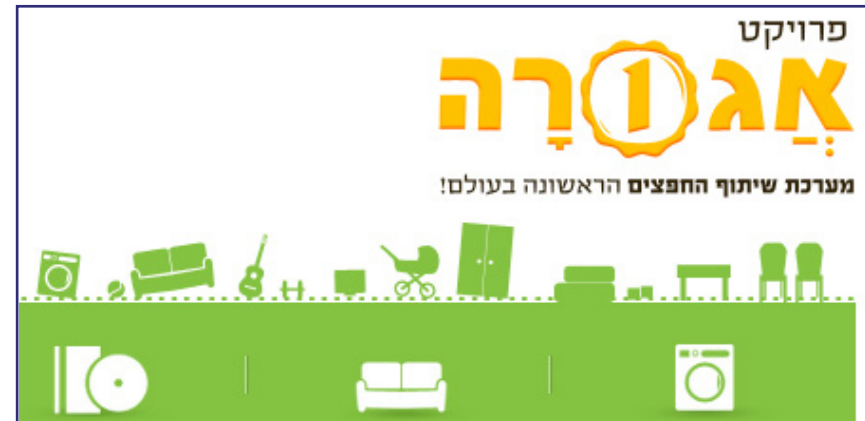
אתר אגורה, אתר אינטרנט ומערכת להחלפת חפצים חינמית