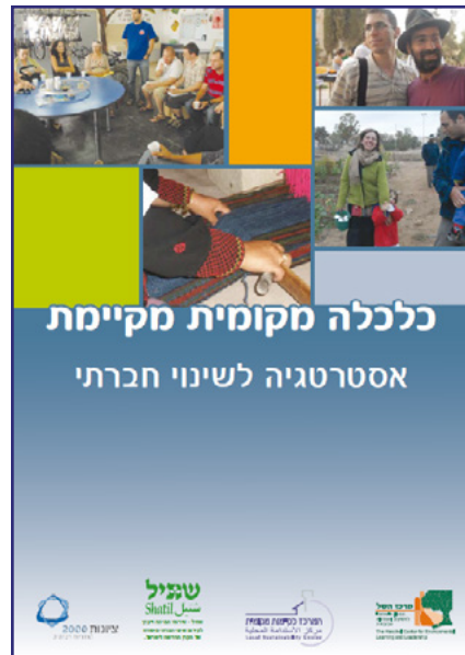
המדריך לכלכלה מקומית מקיימת, מרכז השל, שתיל וציונות 2000

בבחירת מודל זה או אחר חשוב לזכור, כי האתגר המרכזי הוא לזהות את המשאבים הקיימים ואת השיטה המתאימה ביותר ליצור שוק מקומי שיתמרץ שימוש בהם. המאפיינים הטכניים של המערכת הם משניים לצורך העניין ויש להתאימם לאופי הקהילה המקומית וצרכיה.